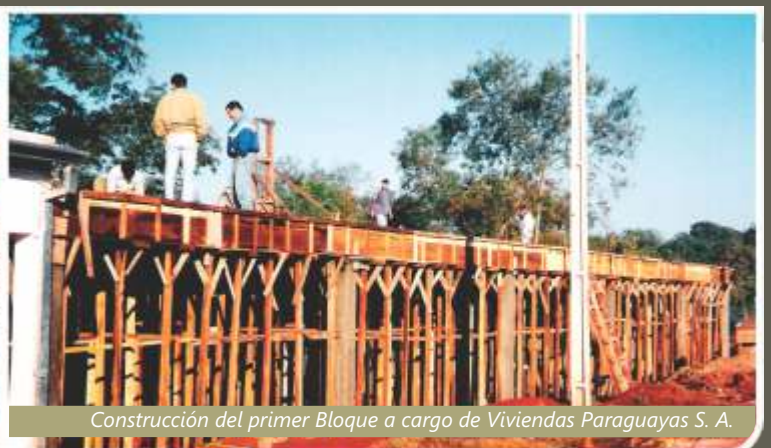
Inicio de las obras del Salón de Uso Múltiple a inicios del nuevo siglo.