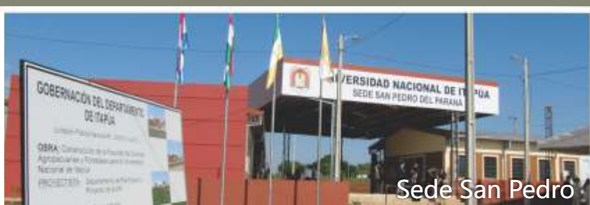
Sede San Pedro