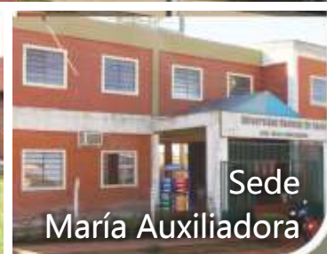
Sede María Auxiliadora