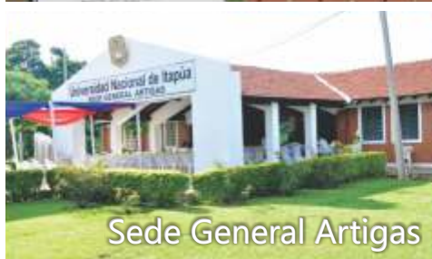
Sede General Artigas