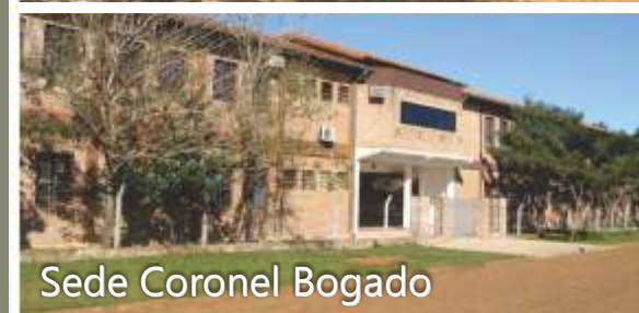
Sede Coronel Bogado